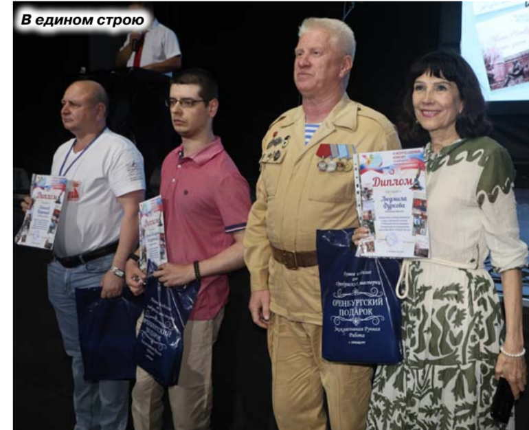
В едином строю