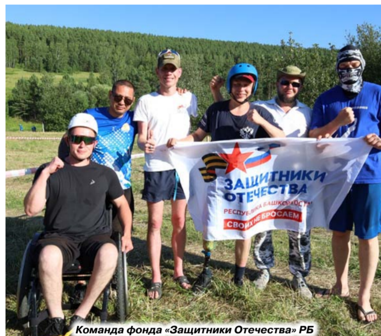
Команда фонда «Защитники Отечества» РБ

Напомним, что первые туристические вылазки в Башкирии были организованы 30 лет назад, когда Флюр Нурлыгайнов (президент РССИ) с соратниками организовывали выезды инвалидов-колясочников на сплав малыми группами. Благодаря их работе адаптивный туризм в Башкирии получил развитие, а затем появился фестиваль ВОИ по спортивному туризму среди инвалидов с ПОДА. Место, выбранное организаторами, уникально и притягивает к себе, как магнит: невероятно красивая природа – высокие холмы и скалы, просторные цветущие поля, красавица Юрюзань, воспитанная в народных песнях и легендах. Здесь родина легендарного героя Башкортостана – Салавата Юлаева, источник целебной воды «Кургазак», санаторий «Янган-