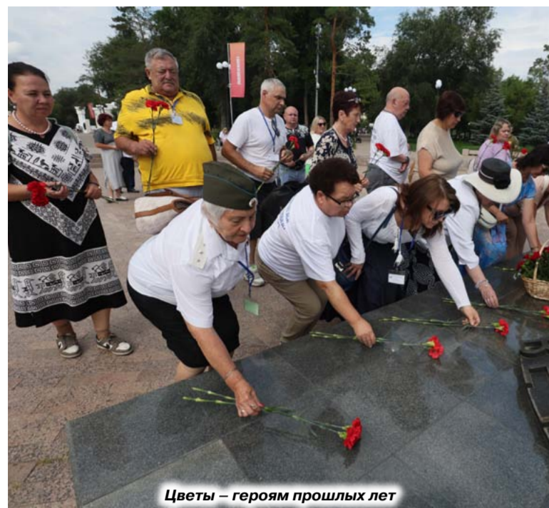
Цветы – героям прошлых лет