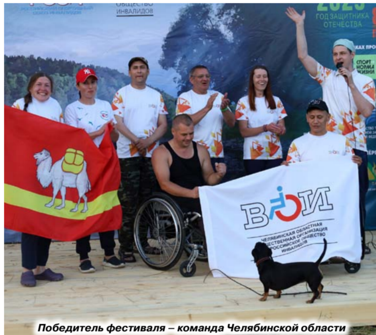
Победитель фестиваля – команда Челябинской области