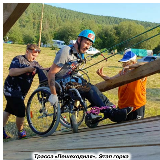
Трасса «Пешеходная», Этап горка