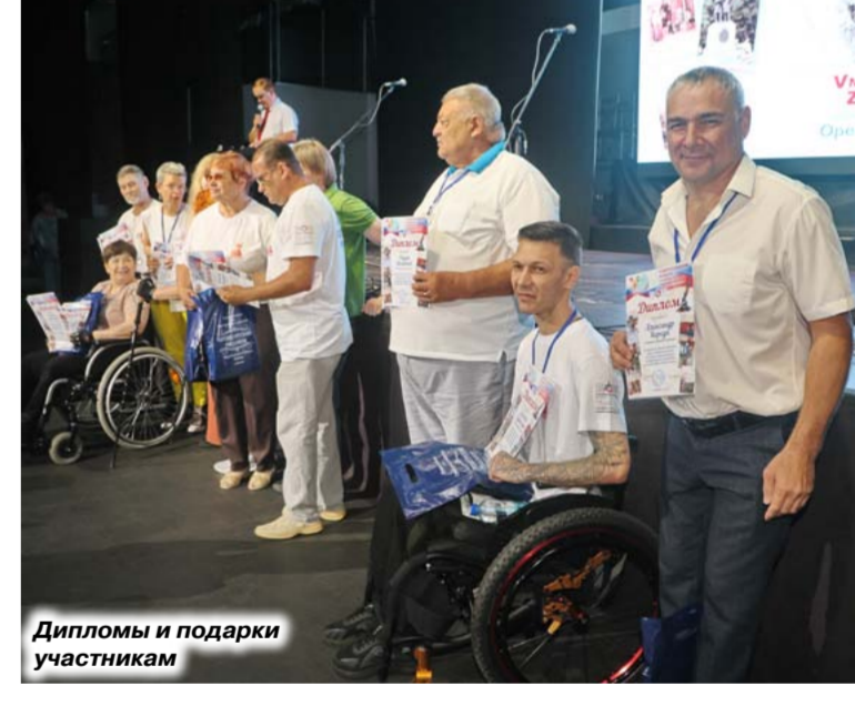
Дипломы и подарки участникам