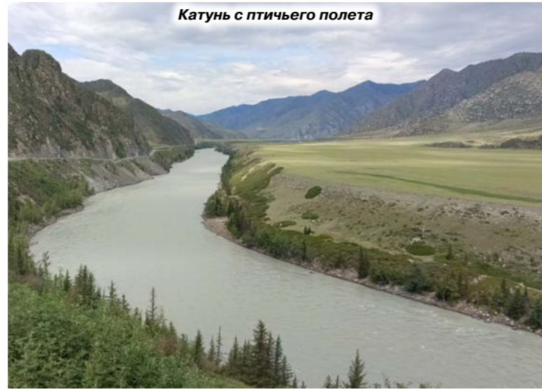
Катунь с птичьего полета