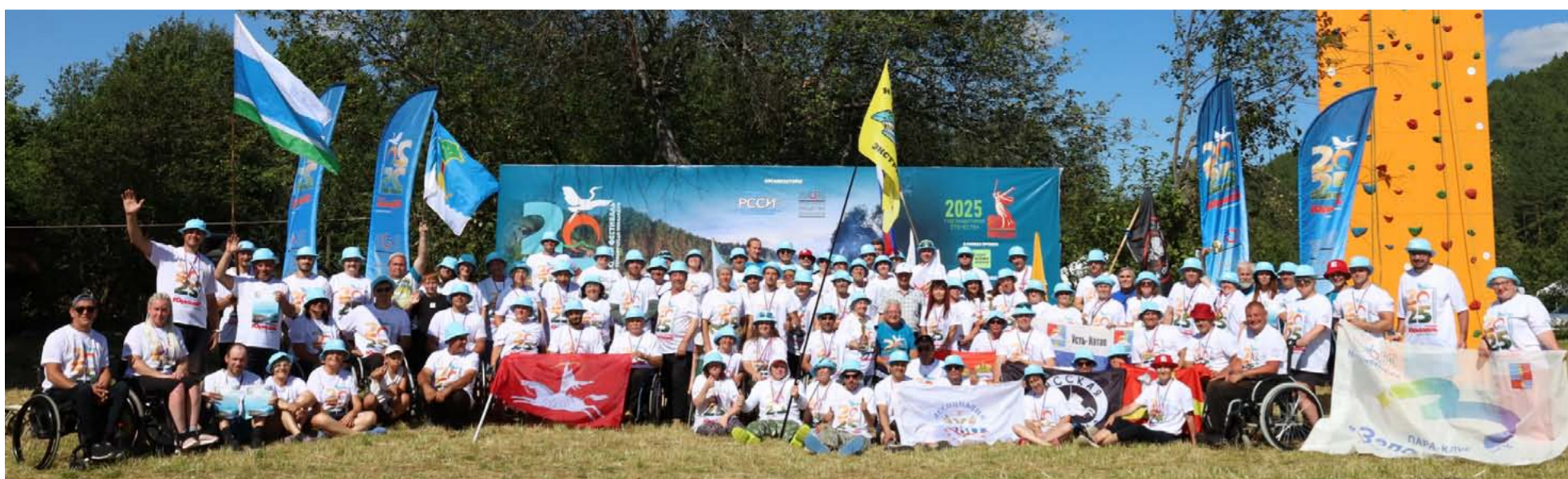
С 9 по 14 июля в Салаватском районе Республики Башкортостан, в геопарке Янган-таус, состоялся XII Всероссийский туристический фестиваль ВОИ по спортивному туризму среди инвалидов с ПОДА «Туриада – Юрюзань 2025».