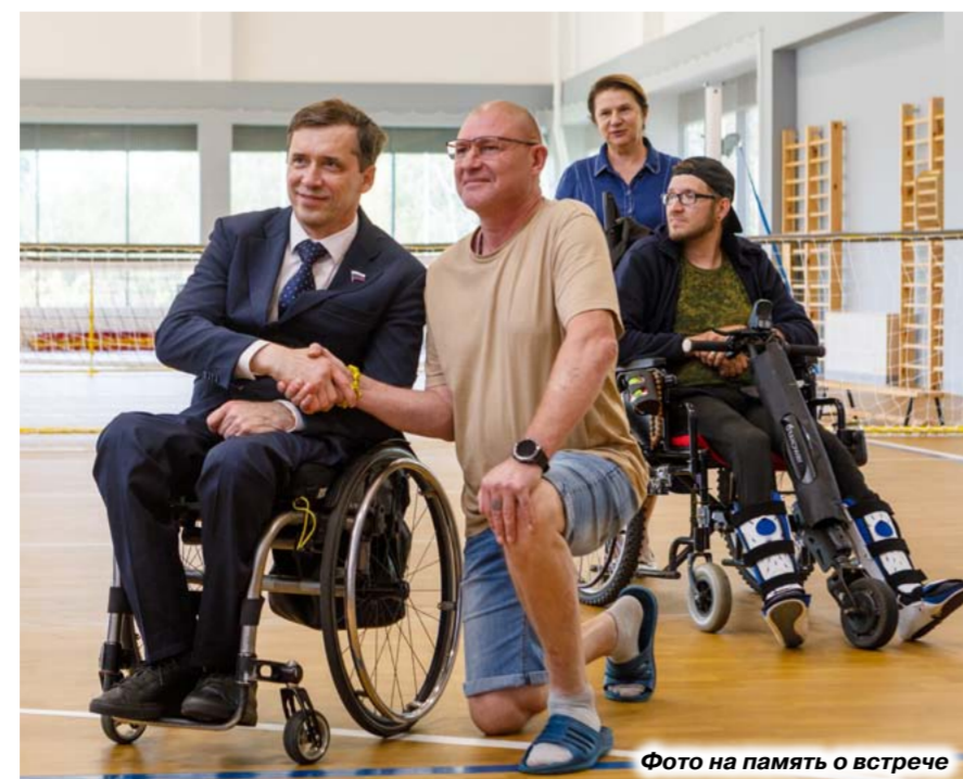
Фото на память о встрече

встреча с паралимпийским чемпионом, ставшим политиком всероссийского уровня. На сцене актового зала была развернута выездная экспозиция Государственного музея спорта, в которую вошли фотографии, личные вещи и документы известных советских и российских спортсменов. Например, свитер и клюшка Александра Овечкина или потрёпанные боксерские перчатки чемпиона Олимпиады 1964 года Валерия Попенченко.