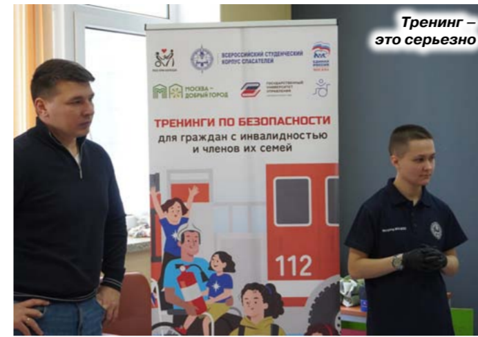
Тренинг – это серьезно