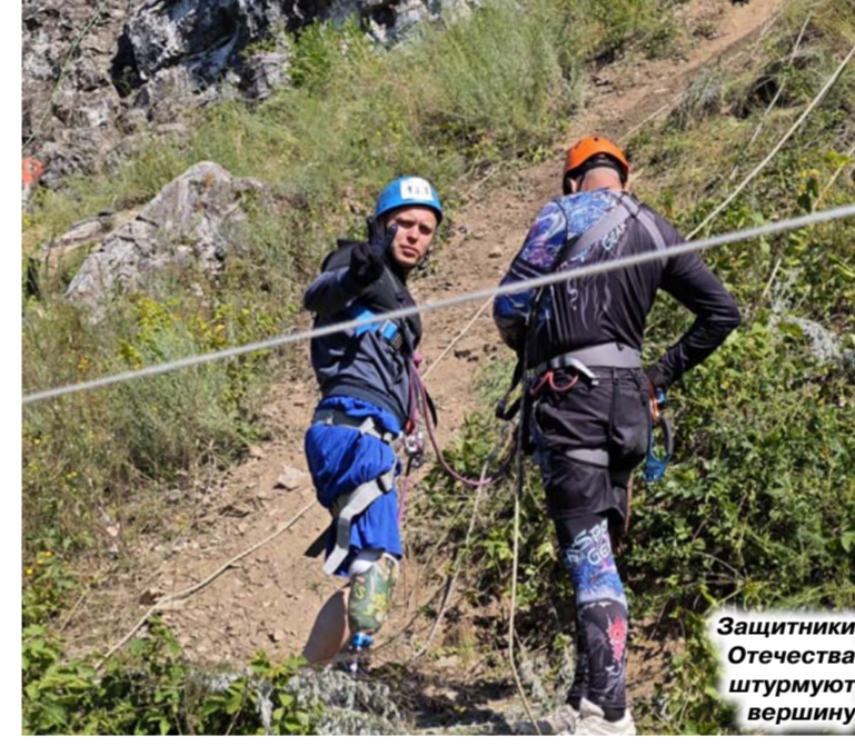
Защитники Отечества штурмуют вершину