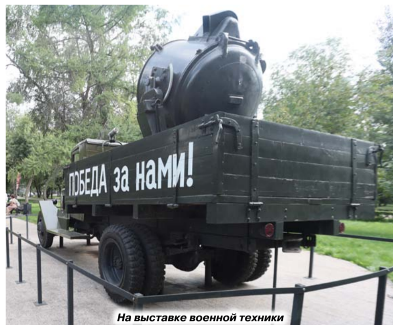
На выставке военной техники