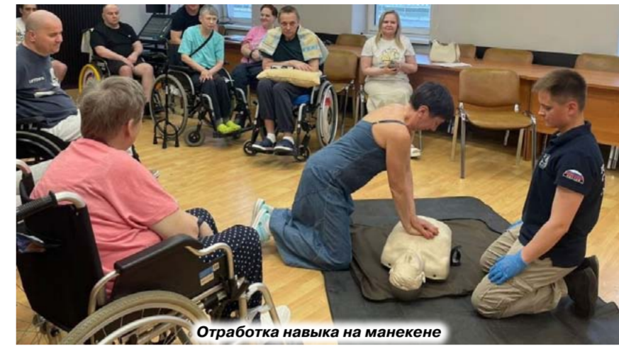
Отработка навыка на манекене