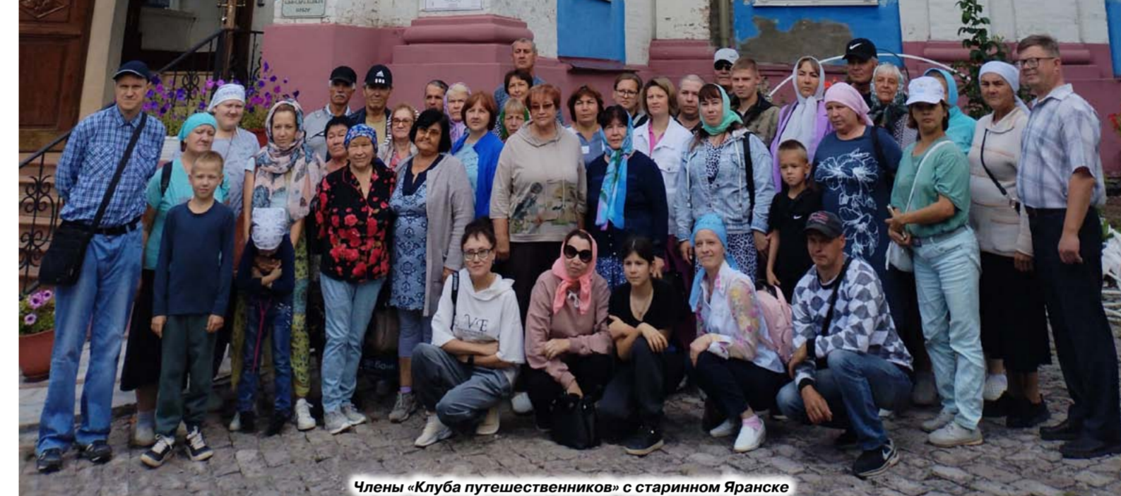
Члены «Клуба путешественников» с старинным Яранске