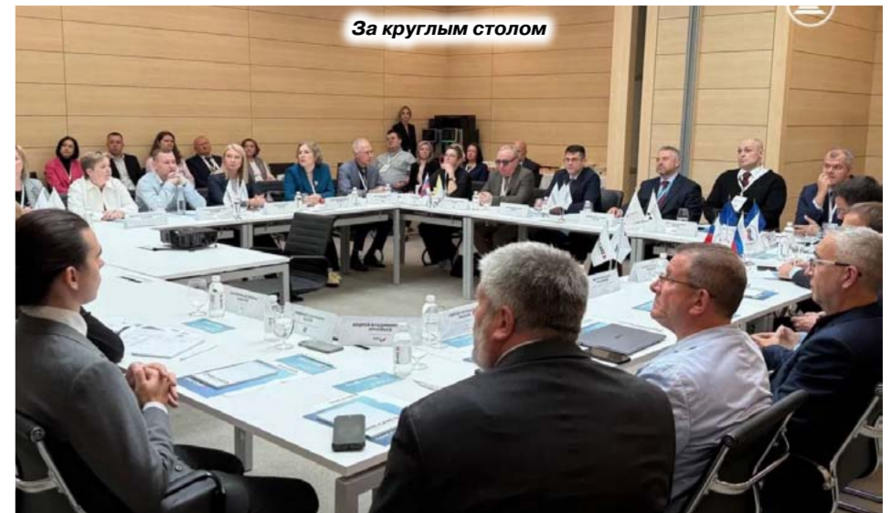
За круглым столом