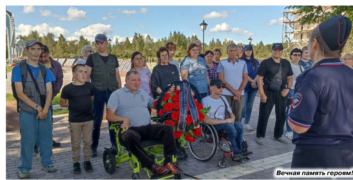
Вечная память героям!

Новгородская областная организация Всероссийского общества инвалидов провела автопробег, посвященный 80-летию Победы в Великой Отечественной войне. Это событие стало не просто данью памяти героическому советскому народу-победителю, но и символом единства, силы духа новгородцев с инвалидностью и безграничной веры в нашу справедливую победу в настоящем.