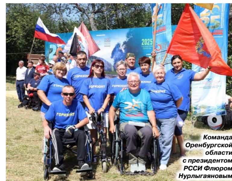
Команда Оренбургской области с президентом РССИ Флюром Нурлыгайновым