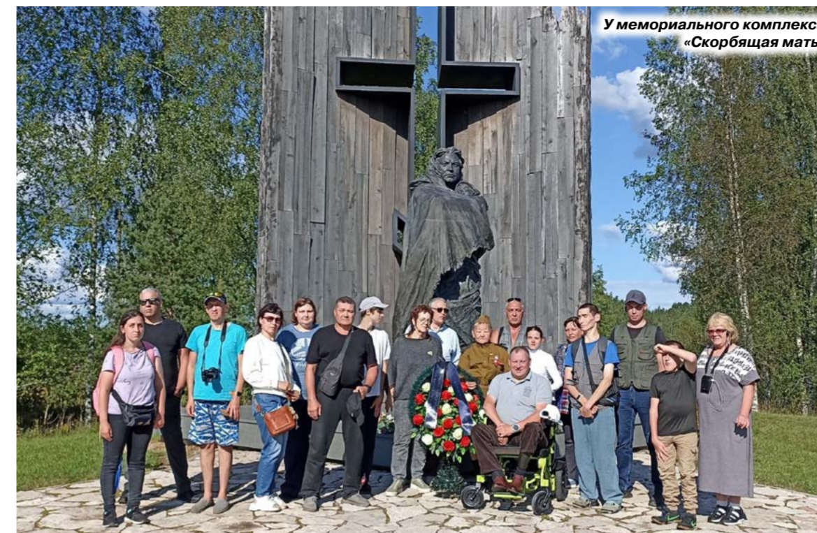
У мемориального комплекса «Скорбящая мать»

Погода стояла замечательная, как будто бы знала, что сегодня здесь соберутся люди необычные, талантливые и творческие, с открытой душой и горячим сердцем. Участники фестиваля пели, танцевали, читали стихи, каждый хотел отличиться, показать свое умение в той или иной номинации. Все было опорой и поддержкой друг для друга.